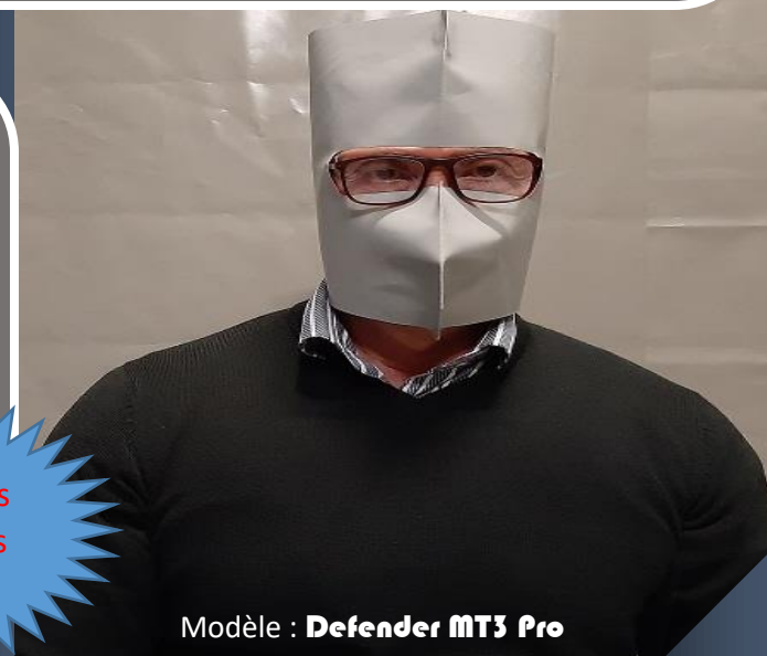
Modèle : Defender MT3 Pro