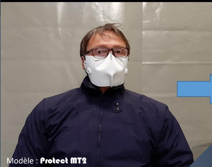
Modèle : Protect MT2