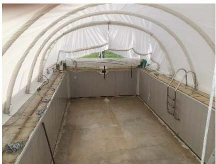
Fin de gonflage