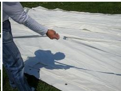
Jusqu'au repère (6 m)