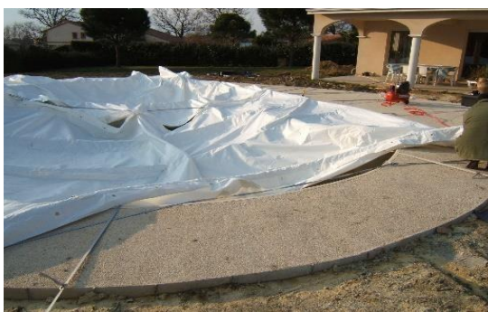
2 modulos réglés et fixés sur bassin

Attention : utiliser les sangles dallage ou sangles déport (inclus dans le kit). Celles-ci vous évitent l'utilisation de lest si vous êtes sur une surface finie. Ces sangles vous permettent de déporter la fixation au-delà du dallage (attachez-les aux 4 coins de l'abri et les fixer à 45°, voir photos) ACM1/90 : compte tenu de sa longueur, il faudra mettre en plus une sangle déport au milieu de l'abri de chaque côté