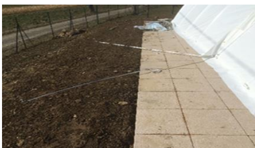
Sangles déports fixés à 45° au raccord de 2 modules