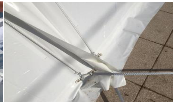
Fixation de la bâchette par ses câbles élastiques