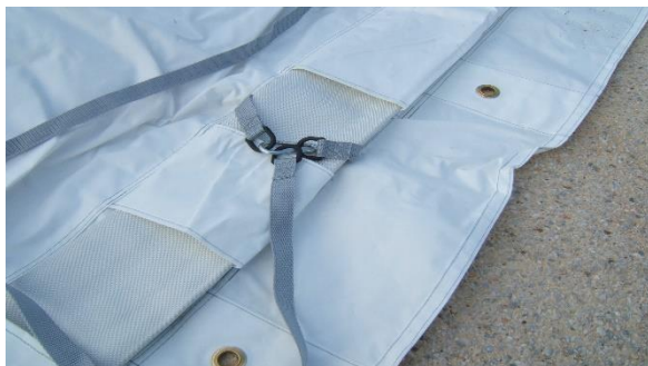
Sangles longitudinales installées sur le boyau au travers des fenêtres n° 2 (voir plan)