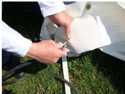
griffe de gonflage