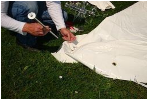
Passage du piquet dans l'anneau

4) Fixer les MODULOS à l'aide des fiches, au travers des anneaux installés à la base de chaque baleine (à la poignée de manutention).