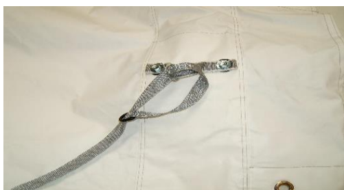
Faire coulisser la sangle déport au travers de la poignée

Attention : utiliser les sangles dallage ou sangles déport (inclus dans le kit). Celles-ci vous évitent l'utilisation de lest si vous êtes sur une surface finie. Ces sangles vous permettent de déporter la fixation au-delà du dallage (attachez-les aux 4 coins de l'abri et les fixer à 45°, voir photos) ACM1/90 : compte tenu de sa longueur, il faudra mettre en plus une sangle déport au milieu de l'abri de chaque côté