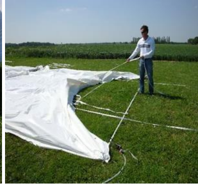
Élévation de la première baleine à 45°