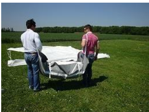
Sac porté aux bretelles

1) Ouvrir le sac à proximité du bassin sur la largeur de la piscine puis dérouler les MODULO sur le dos (baleines et passants visibles).