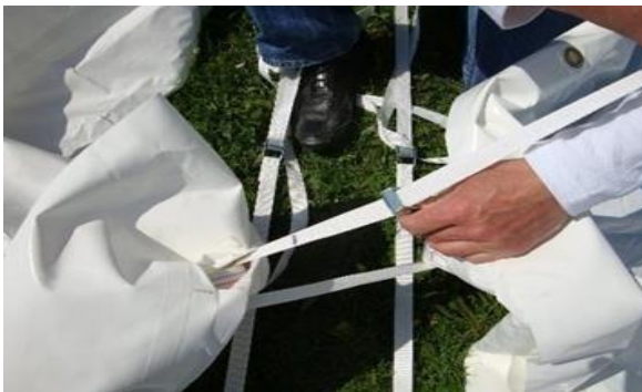
Ne pas dépasser la marque