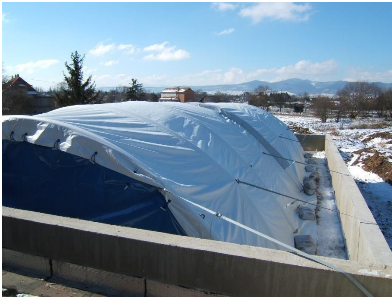
Sangles grands vents installées

N.B : Les sangles déports, les sangles longitudinales et les sangles grands vents sont toutes identiques