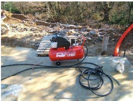
Gonfleur standard (non inclus)

Ne pas soulever la baleine avant la pression mini.