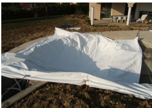
1 modulo réglé et fixé sur bassin