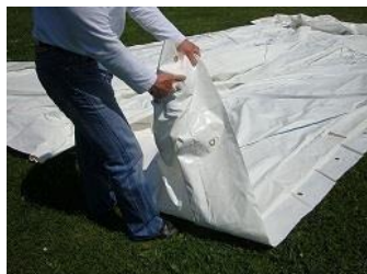
Poignée de manutention

Attention : bien aligner les MODULOS en fonction des dimensions du bassin (équerrage).