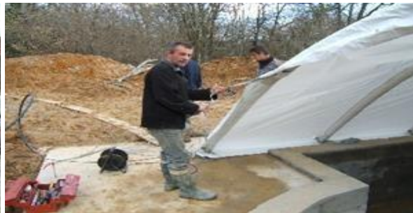
Fixation sangle longitudinale