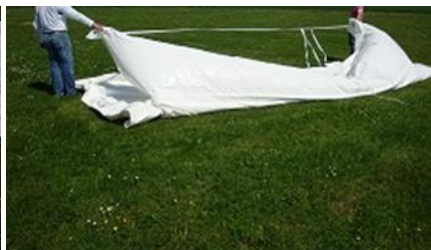
Retournement du modulo