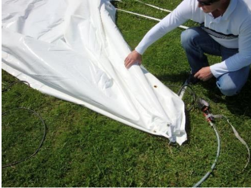
Pression de la première baleine à 6 bars

7) Après le gonflage de la première baleine, la soulever à l'aide des sangles longitudinales sans toutefois l'amener à la verticale, puis la fixer avec les sangles longitudinales