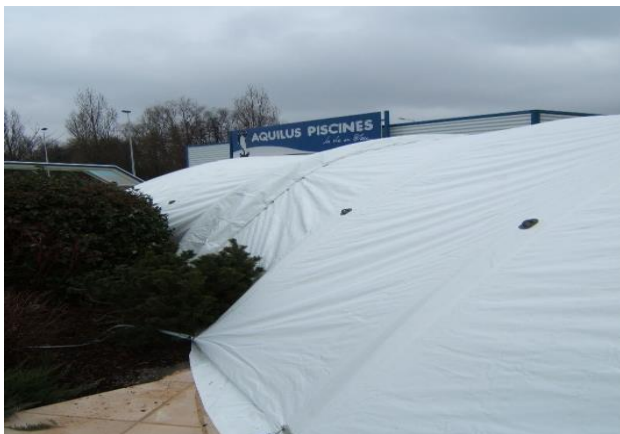
Évite les obstacles