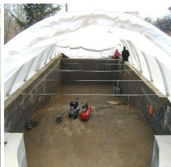
2 modulos en cours de gonflage