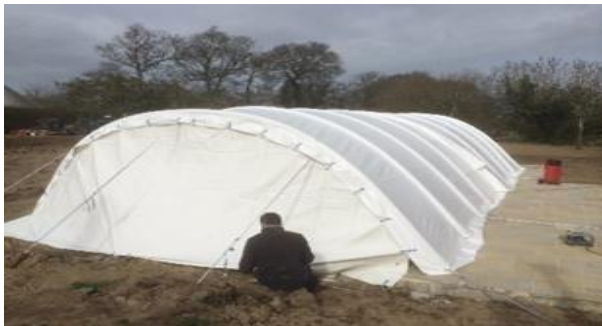
2 modulos montés avec portes