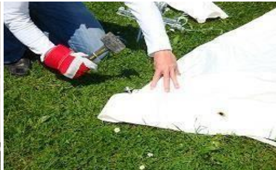
Piquet planté dans son anneau