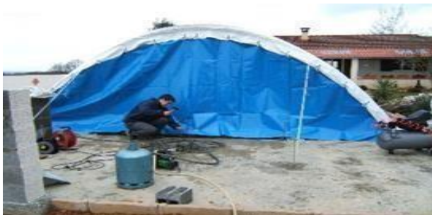
Tension bas de porte, si porte inclinée