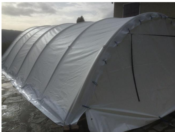
Porte installée sur ACM1 / 90