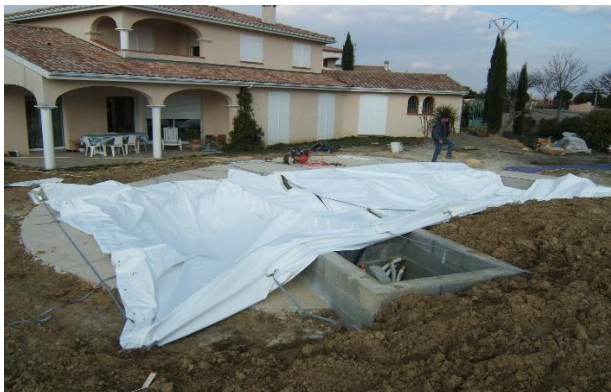
Modulo installé au-dessus d'un puit