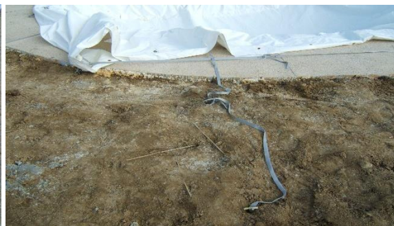
Sangles longitudinales fixées à env. 1,50 m de l'abri et non tendues