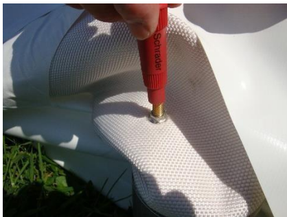
clé à obus