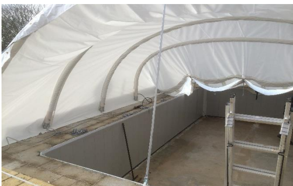
Modulos fixés en cours de gonflage vue intérieure