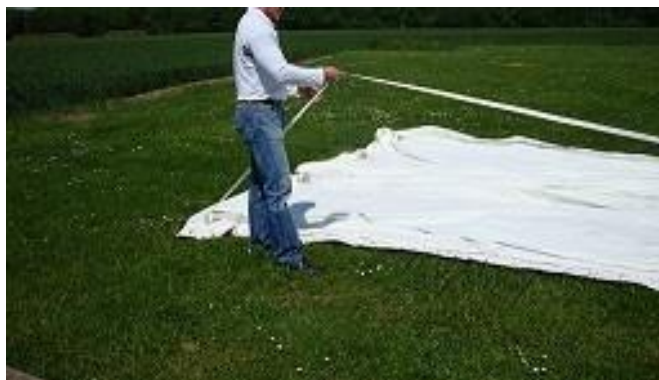
Réglage Sangles de bases

2) Régler les sangles bases (sangles reliant les pieds) jusqu'au niveau des repères (marquage noir sur la sangle pour 6 m), à l'aide de la boucle CAM. Si vous souhaitez moins de longueur ou plus, régler la CAM en conséquence.