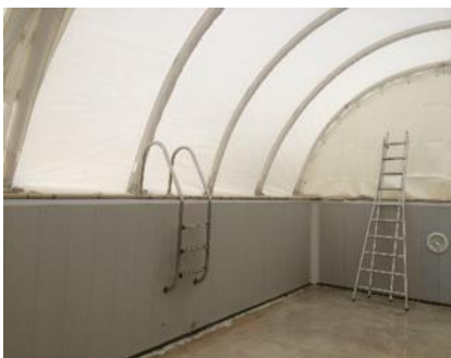
2 modulos installés