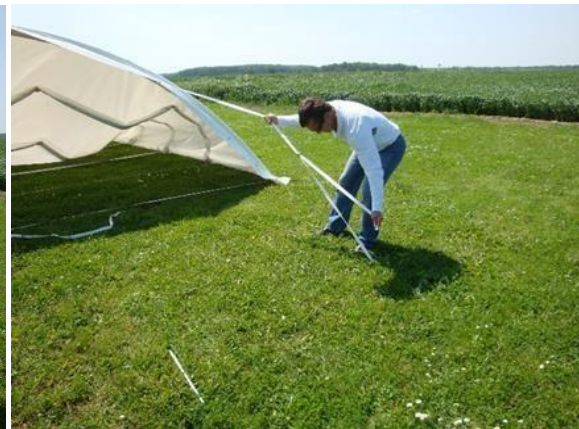
Tension des sangles longitudinales