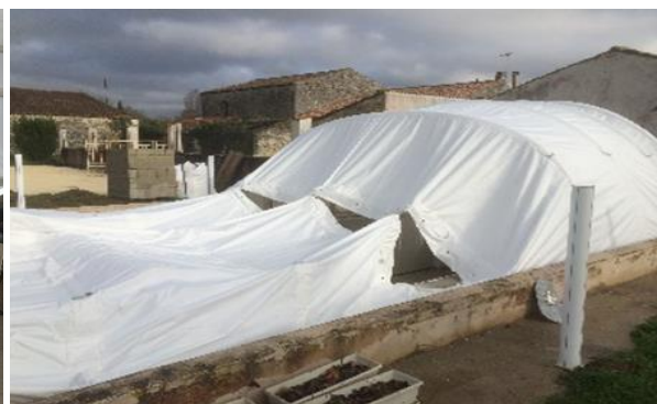
Modulos fixés en cours de gonflage vue extérieure

Pour le gonflage des tubes centraux, il est préférable de gonfler le 1 er à 50% (3 bars), puis le second à 100% (6 bars)