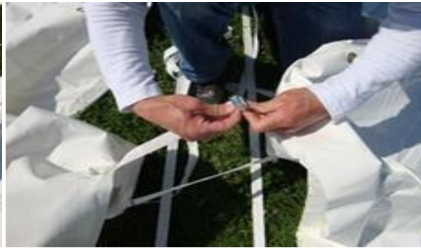
Les passer au-dessous des sangles bases