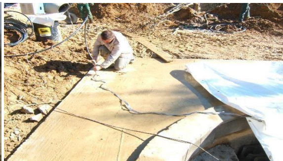
Fixation sangles longitudinales sur béton