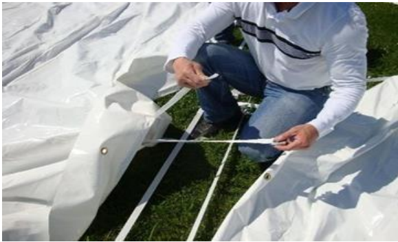
Sangles raccord X 5