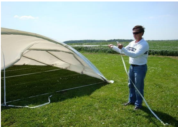
Fixation des sangles longitudinales

Lorsque l'ensemble est positionné, régler et tendre les sangles longitudinales. Ce réglage ne doit être effectué que lorsque l'abri est totalement arrondi, d'une forme régulière (répartir la tension entre les 2 sangles pour avoir une courbure régulière).