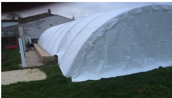
Absorbe les dénivelés