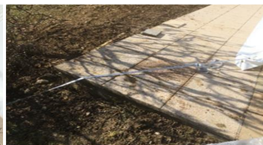
Sangles déports fixés à 45° sur dallage