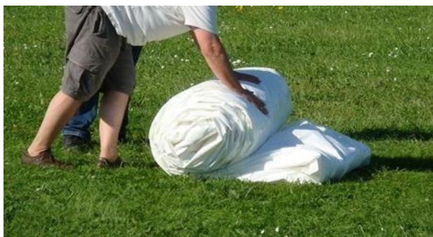
Roulage du modulo du fond vers les gonfleurs

Démonter les accessoires (portes et bâchette). Dégonfler*, dégager l'abri et le remettre sur le dos (baleines visibles). Dégrafer les sangles. Enlever les accessoires : les portes et la bâchette de recouvrement s'il y a deux modules installés. Défaire les fixations aux angles (soit aux pieds de l'abri, soit aux sangles départ). Laisser toutes les sangles sur l'abri, elles seront déjà installées pour le prochain. Ramener l'abri à l'extérieur du bassin. Dégrafer les sangles de bases jusqu'à ce que l'abri soit complètement à plat, (il est préférable de ne pas les dégrafer complètement). Une fois plié sur sa largeur (largeur du sac), rouler toujours l'abri du fond vers les valves. Vous pouvez faire un repli d'un mètre à la fin du roulage. Cela vous aidera à la manutention de l'abri roulé puis déposer le sac à proximité de l'abri roulé et faire glisser ce dernier sur son sac puis refermer le sac avec ses sangles de serrage.