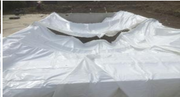
2 modulos fixés avant gonflage