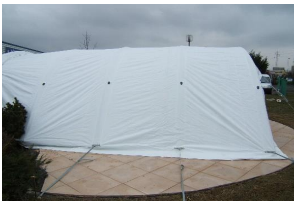
Modulo avec sangles départ