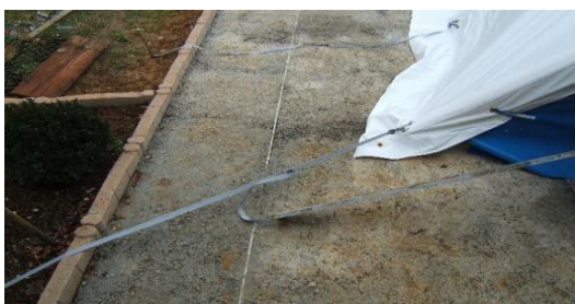
Sangles déport fixés à 45° sur béton