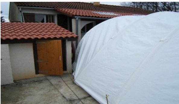
Évite les obstacles