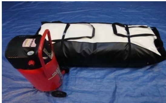
Modulo replié dans son sac (gonfleur non fourni)