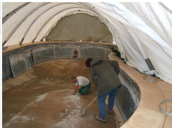
Modulo sur piscine multiforme