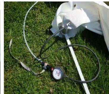
poignée bloquée par sangle ou tirap / colson