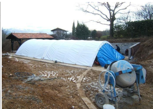
Porte inclinée = plus de longueur (0,50 m à 0,75 m)/porte