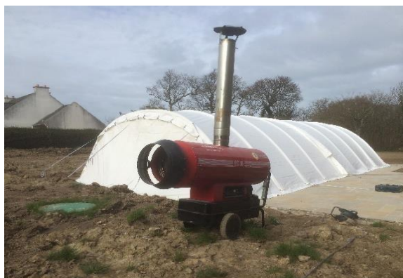
Chauffage fioul (conseillé)