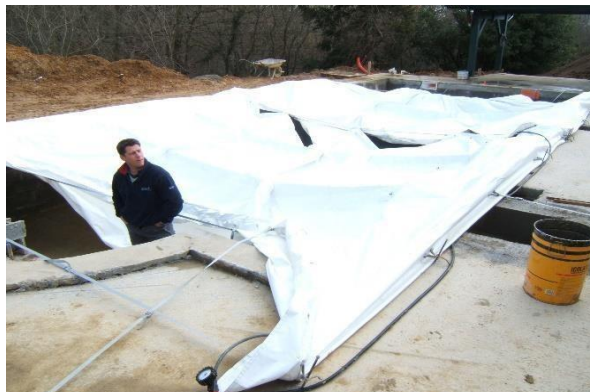
2 modulos fixés et 1 ère baleine en cours de gonflage