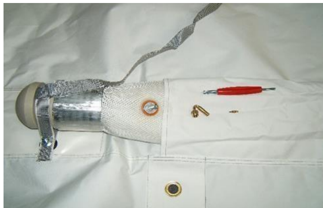
Accessoires de gonflage