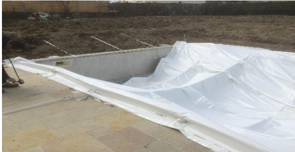
Modulo fixé avec 3 sangles longitudinales

N.B : une troisième sangle peut être installée sur la fenêtre 3